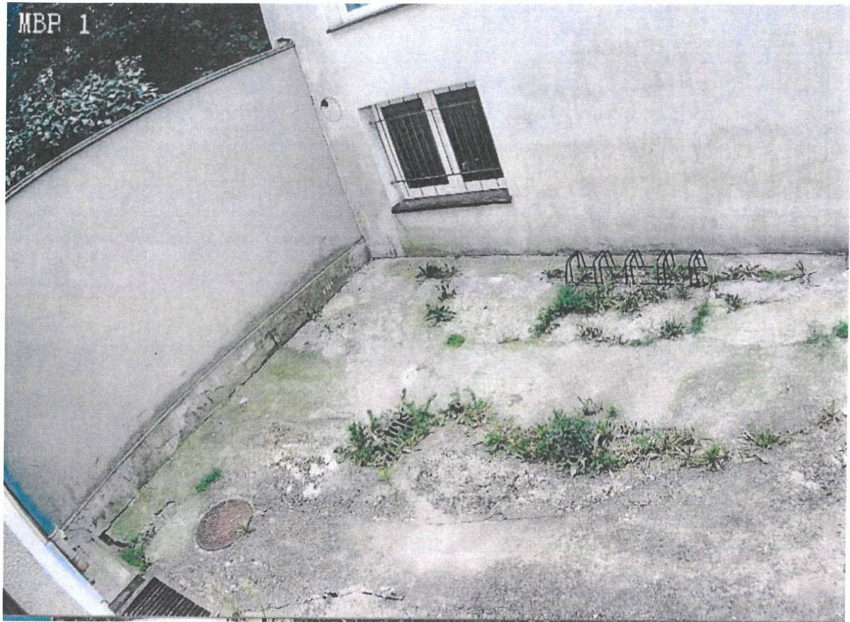
Aktualny stan